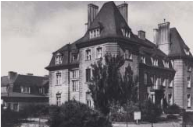
Das Kaiser-Wilhelm-Institut für physikalische Chemie und Elektrochemie in Berlin-Dahlem.

stätten zurück, an denen seine erfolgreiche wissenschaftliche Laufbahn begonnen hatte. In dieser Zeit der allgemeinen Lähmung und Auflösung machte er sich an den Wiederaufbau der ihm anvertrauten Institute, sodass zunächst der Lehrbetrieb wieder aufgenommen werden konnte. Er bemühte sich darüber hinaus – wie Einstein und Haber nach dem Ersten Weltkrieg – um die Reorganisation des gesamten naturwissenschaftlichen Lebens in Deutschland und um die Wiedereinbindung der deutschen Wissenschaftler in die internationale Wissenschaftsfamilie, aus der sie durch den Nationalsozialismus gedrängt worden waren. Hierbei war KFB besonders deshalb so erfolgreich, weil er ein so hohes internationales wissenschaftliches Ansehen besaß und wissenschaftliche Freunde rund um den Erdball hatte und weil er als unbeugsame und aufrichtige Persönlichkeit voller Toleranz und Integrität bekannt war, die niemals aus Opportunismus oder um des persönlichen Vorteils willen handelte, sondern immer zum Wohl der Gemeinschaft. Was KFB in dieser Zeit für die deutsche Wissenschaft geleistet hat, ist öffentlich kaum wahrgenommen worden, hat aber die volle Anerkennung seiner Fachfreunde gefunden und ihm selbst stille innere Befriedigung gewährt.