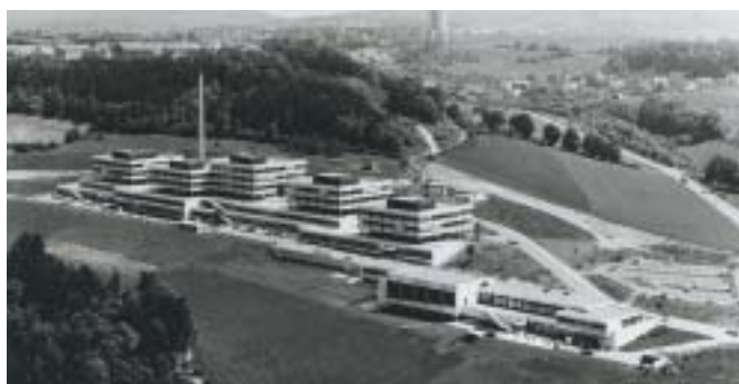
Das Karl-Friedrich-Bonhoeffer-Institut für Biophysikalische Chemie der Max-Planck-Gesellschaft in Göttingen.

Den Erfolg von KFBs wissenschaftlicher Brillanz können wir aber messen an der Zahl weiterer Berufungen oder Berufungsanfragen, die er vor bzw. nach dem Kriege erhielt, die er aber ablehnte: Bonn, Breslau, Cambridge (Harvard University), Charkov, Chicago, Halle, Hamburg, Heidelberg, Karlsruhe, München, Zürich. Oder wir können ihn messen an den äußeren Ehrungen, die er erhielt, aber nie suchte: Er war Mitglied der Sächsischen Akademie der Wissenschaften in Leipzig, der Deutschen Akademie der Naturforscher Leopoldina in Halle, der deutschen Akademie der Wissenschaften in Berlin, korrespondierendes Mitglied der Bayerischen Akademie der Wissenschaften in München und Ehrenmitglied der New York Academy of Sciences. Die Göttinger Universität ernannte ihn später zum Honorarprofessor. Er war Inhaber der Bunsendekmünze der Deutschen Bunsengesellschaft (1955), deren Vorsitzender er 1951 und 1952 war, posthum wurde ihm die Palladiummedaille der Electrochemical Society verliehen.