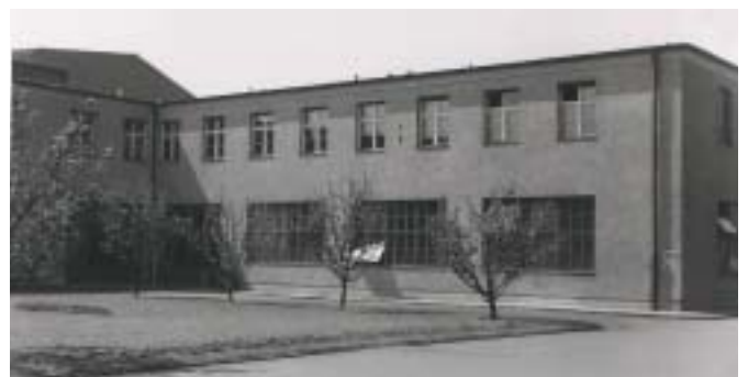
Das Max-Planck-Institut für Physikalische Chemie in Göttingen.