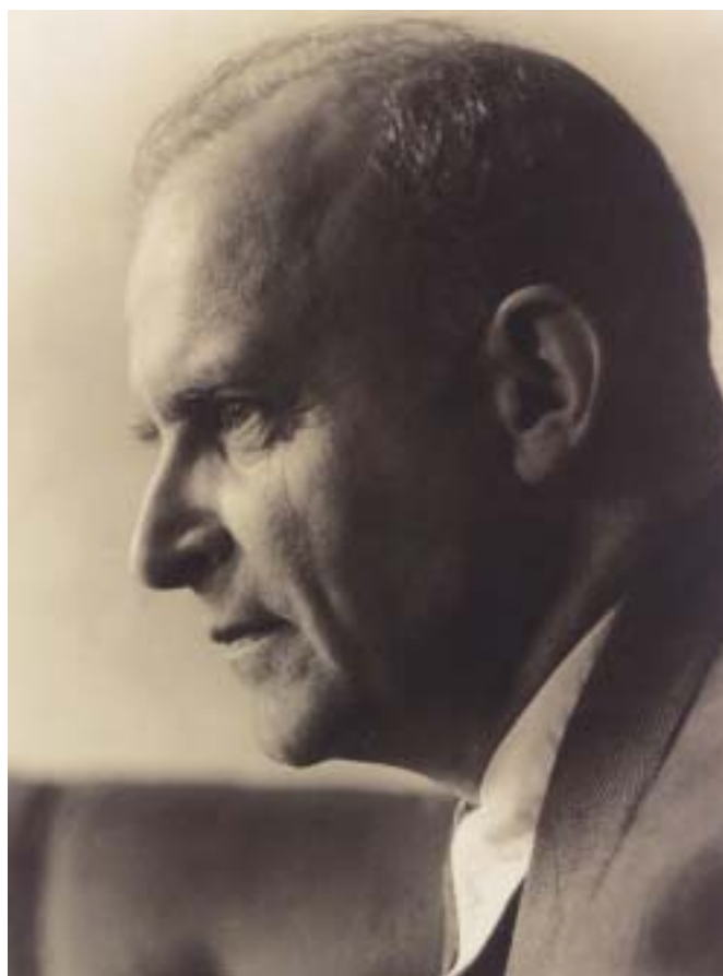
Karl Friedrich Bonhoeffer (um 1957).