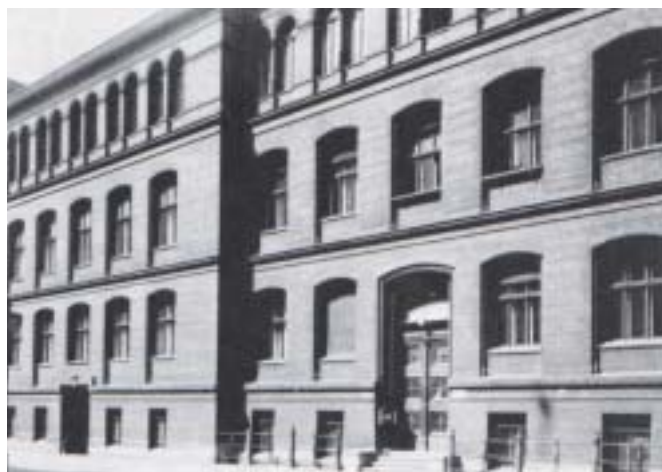
Das physikalisch-chemische Institut der Berliner Universität in der Bunsenstrasse.

Diese elektrochemischen Arbeiten wurden durch die Kriegsergebnisse und die Zerstörung des Leipziger Institutes unterbrochen. KFB wurde 1947 als Ordinarius auf den Lehrstuhl für physikalische Chemie der Berliner Universität und 1948 als Direktor des Kaiser-Wilhelm-Institutes für physikalische Chemie in Berlin berufen; er kehrte also als Nachfolger von Nernst und Haber an die Wirkungs-